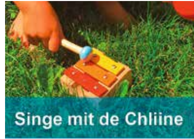
Singe mit de Chliine

Singen für die Aller kleinsten bis ca. 4 Jahre in Begleitung einer Betreuungsperson